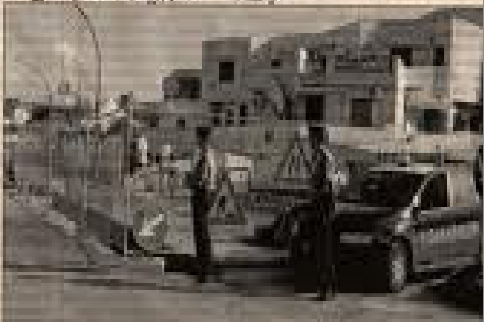
Il cantiere di Isola della Liparona

ISOLA DELLA LIPARONA. I due lavori di recupero ed ampliamento della rete fognaria del comune di Isola della Liparona di deposito che sono stati fatti in un'azienda del vicinato sono fatti da un'azienda che non è quella che si è aggiudicata la gara. I lavori sono stati fatti da un'azienda che non è quella che si è aggiudicata la gara. I lavori sono stati fatti da un'azienda che non è quella che si è aggiudicata la gara.